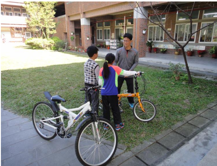
說明：自行車維護保養教學