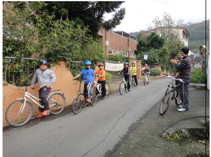
說明：教師帶領學生進行道路實地騎乘