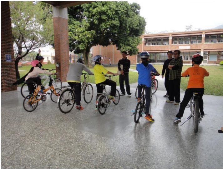
說明：健體課實施自行車安全教育