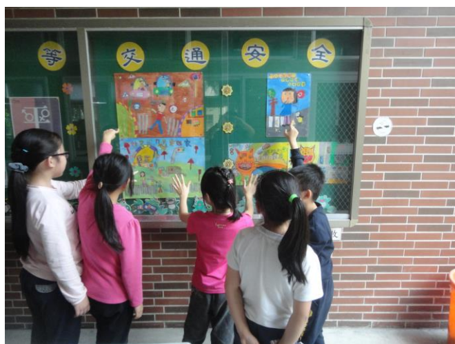
說明：交通安全宣導海報比賽優良作品