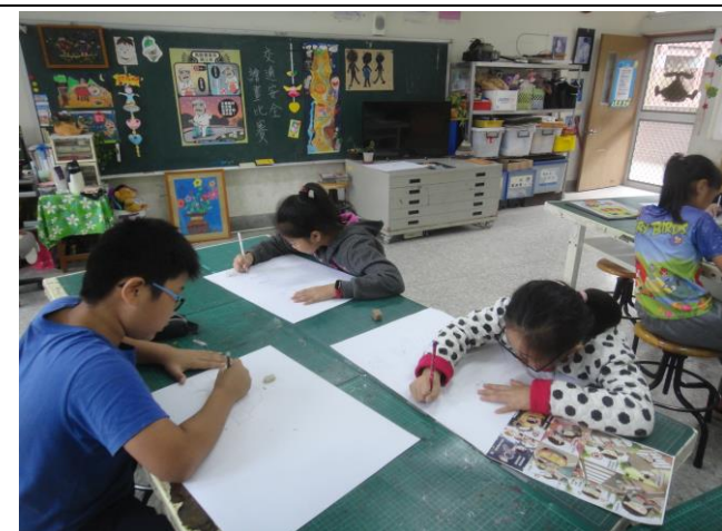
說明：交通安全漫畫比賽