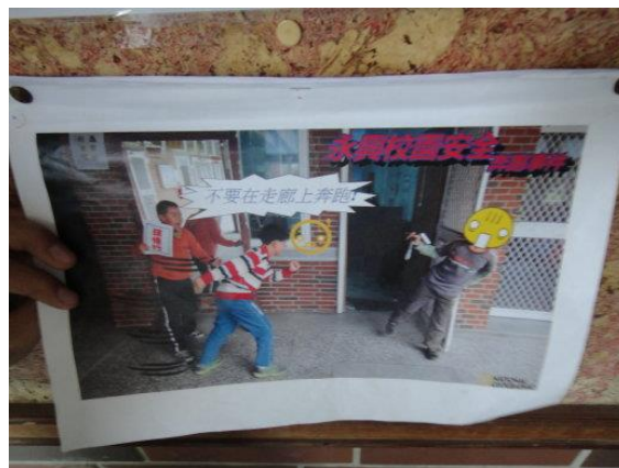
說明：校園宣導漫畫--走廊不奔跑