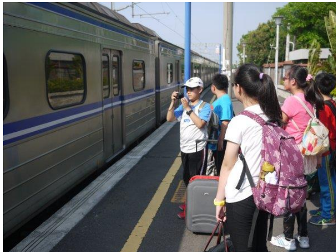
說明：了解搭乘大眾運輸工具之規則