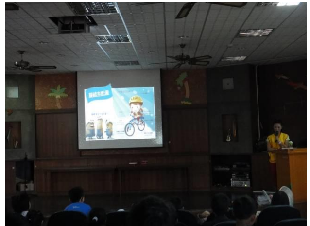
宣導騎自行車必要裝備