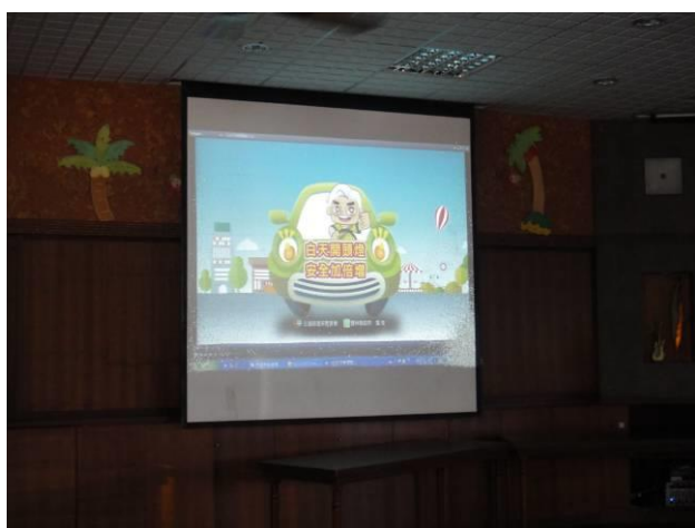
汽機車全天開頭燈加倍安全