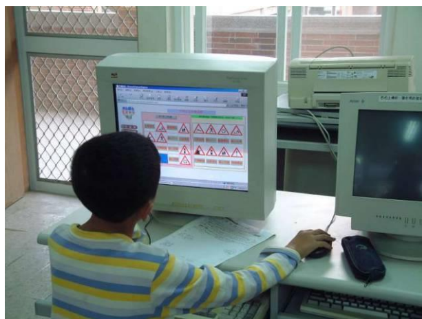
說明：資訊融入教學