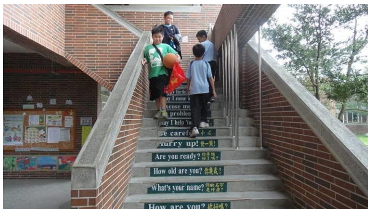
說明：交通安全情境教學-校園內行的安全