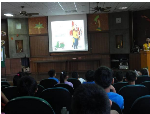
宣導騎乘機車戴安全帽