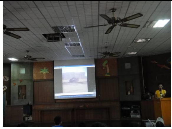
有獎徵答學生踴躍舉手回答