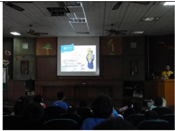
宣導繫安全帶的重要性