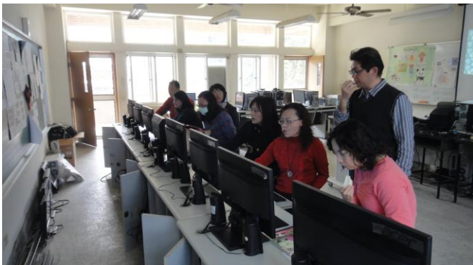
說明：學期初交通安全網頁介紹