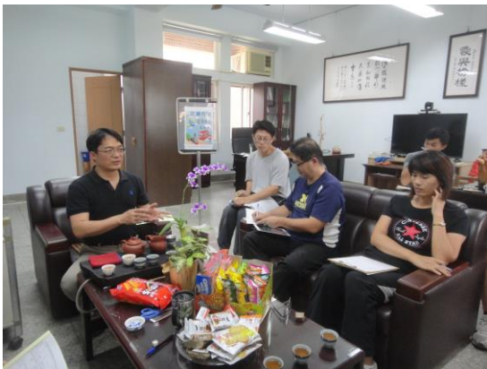
說明：學期末交通安全會議