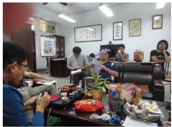
說明：學期末交通安全會議