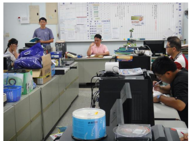
說明：學期初交通安全會議