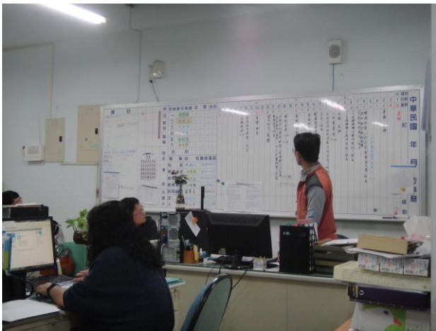
說明：學期末交通安全會議