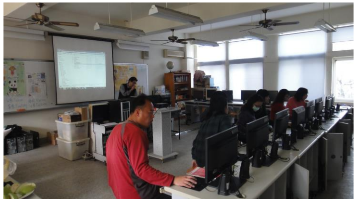
說明：學期初交通安全網頁介紹