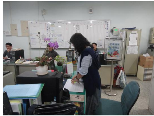
說明：學期初交通安全會議